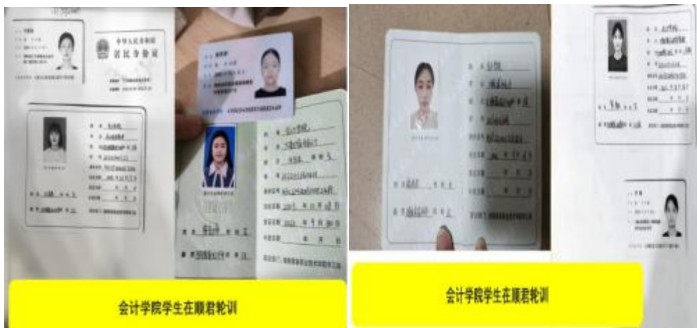
图 3 商务职院在顺君公司校企合作基地专项轮训部分学生证件

顺君公司校企合作基地长期为学生有偿提供管理、服务类(如门店管理、收银服务等)勤工俭学岗位。