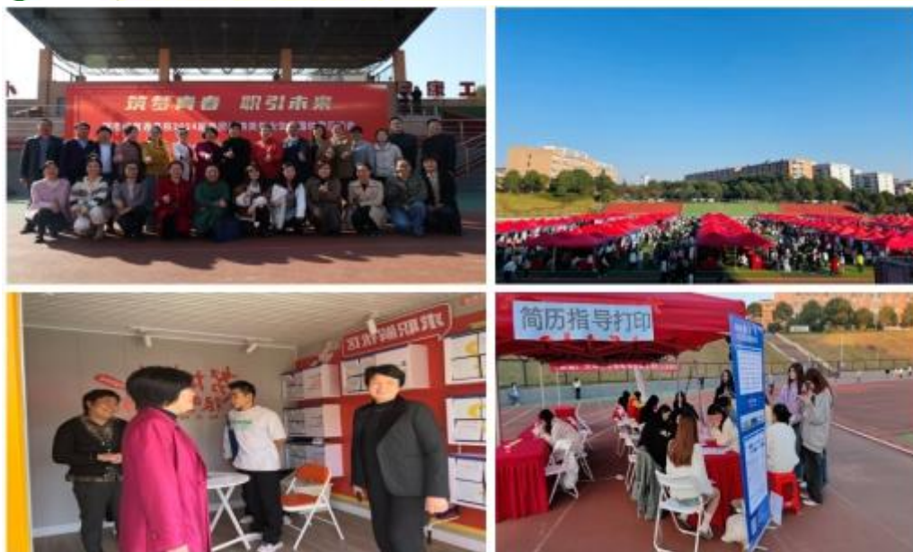
图9 顺君公司组织长沙市零售商业行业协会单位参加 2024毕业生大型招聘会