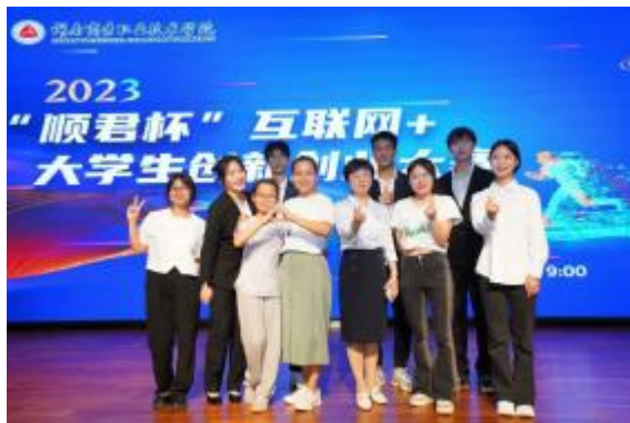
图 4 2023 年 商务职院“顺君杯”互联网+大学生创新创业大赛现场