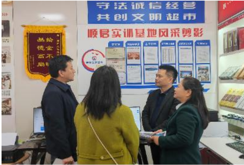
图 1 商务部领导与商务职院、顺君公司代表开展交流