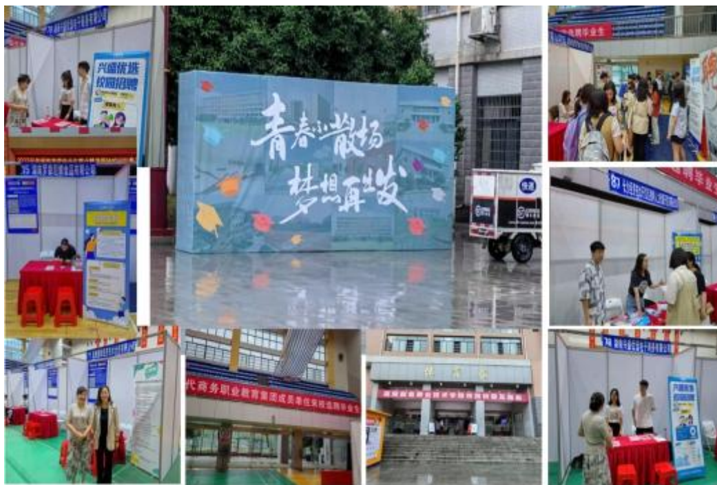
图8 顺君公司组织长沙市零售商业行业协会单位参加2023毕业季精准帮扶供需见面会

余家协会成员企业参加了商务职院的专场招聘会议。顺君公司还设立了实习生计划，为应届毕业生提供实习机会和职业发展路径，使得新鲜血液源源不断地注入企业。